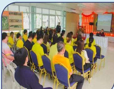
วันที่ 20 เช้า เรื่อง เศรษฐกิจพอเพียง ณ เรือนจำชั่วคราวเขาระกำ จ.ตราด