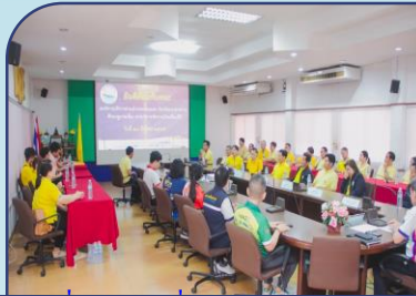
วันที่ 20 บ่าย เรื่อง การบริหารจัดการบ้านเมืองที่ดีตามหลักธรรมาภิบาล ณ เทศบาลเมืองตราด