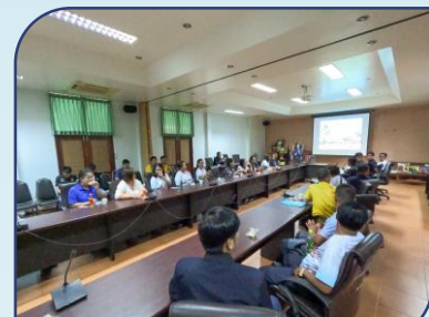
วันที่ 22 เช้า เรื่อง การวิจัยและพัฒนาพืชสวนเศรษฐกิจ ณ ศูนย์วิจัยพืชสวน จ.จันทบุรี