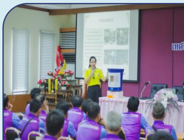
วันที่ 21 เช้า เรื่อง การบริหารจัดการขยะ ณ เทศบาลตำบลพลับพลาจารย์