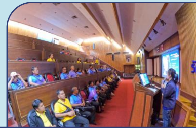
วันที่ 21 บ่าย เรื่อง การพัฒนาอ่าวคุ้งกระเบนอันเนื่องมาจากพระราชดำริ ณ ศูนย์ศึกษาการพัฒนาอ่าวคุ้งกระเบนอันเนื่องมาจากพระราชดำริ จ.จันทบุรี